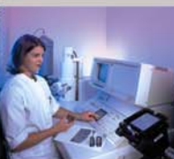
Forschung und Entwicklung

SCHERDEL GmbH Scherdelstr. 2, 95615 Marktredwitz Telefon: +49 9231 603-0, Fax: +49 9231 62938 Email: info@scherdel.de , www.scherdel.de