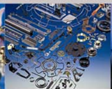
Stanz- und Biegeteile