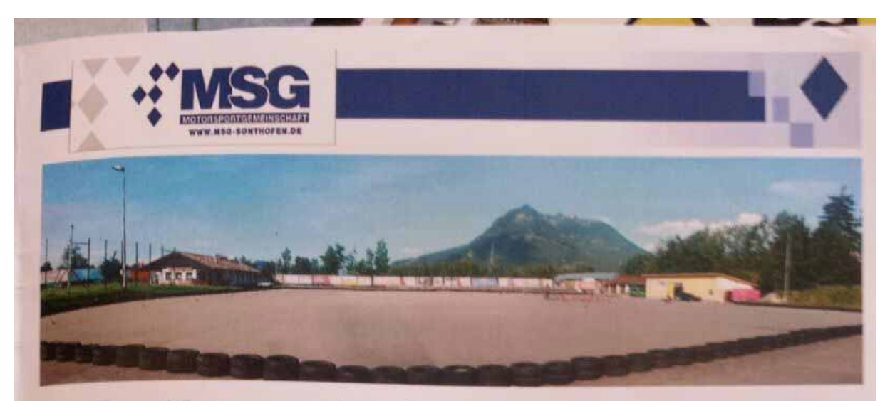
- Der Motorsportpark und seine Umgebung -